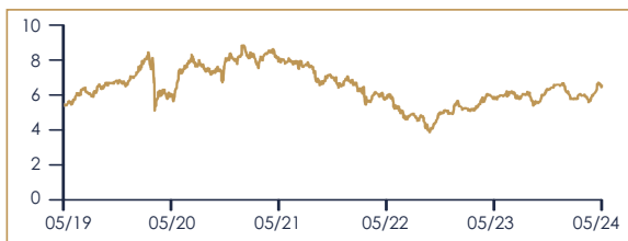
ANDAMENTO AZIONE ENEL S.P.A.: ULTIMI 5 ANNI*